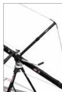
Separable King Post for versions „S-M“

Direkte Veränderung des Krankopfswinkels