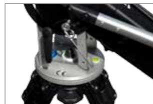
Lever forward/backward for directly changing the angle of the crane head

Direkte Veränderung des Krankopfswinkels