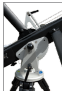
Crane support 120 with vertical brake